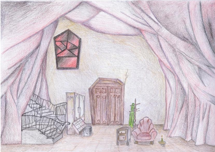
Figura 1- Tecnica: matite colorate

solamente dalla linfa del possedere ricchezze, ed una volta tolte queste passa direttamente dalla vita alla inesistenza. La finestra ci rimanda a questa sensazione, poiché è sì un possibile sbocco con l'esterno, ma essendo realizzata con colori scuri la luce che potrebbe raggiungerlo e salvarlo, arriva sotto una chiave diversa, che non gli fa vedere come sono realmente le cose al di fuori della sua testa. Dalla porta presente sul fondale possono solo entrare gli altri personaggi, lui non può uscirne, si torna così a sottolineare la limitatezza della sua persona, costantemente chiusa in se stessa.