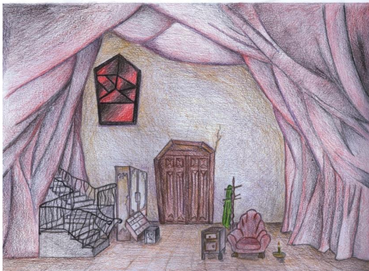
Figura 2 - Studio per le luci