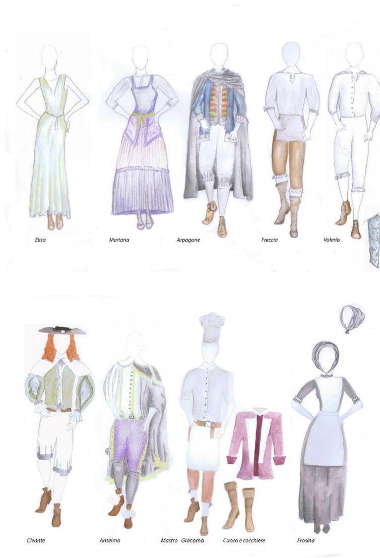
Figura 4 e 5 - Tecnica: matite colorate e acquerello

I costumi dei servi sono semplici, lineari e analoghi fra di loro. Nonostante lavorino presso una famiglia agiata, le loro vesti sono rovinate.